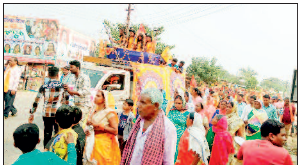
हरिभूमि न्यूज़ ▶▶ गुरुर

द्वीमर निषाद समाज द्वारा भक्त गुहा निषाद राज जयंती धूमधाम से मनाया गया। इस अवसर पर नगर के निषाद समाज द्वारा श्री राम, लक्ष्मण व सीता माता की वेशभूषा में झांकी के साथ कलशयात्रा निकाली गई।